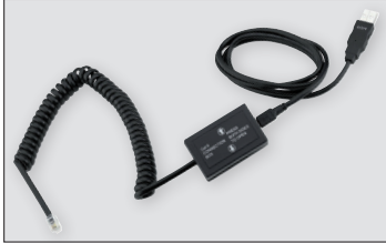
IntelliConnector è compatibile con tutta la gamma di nebbiogeni PROTECT.