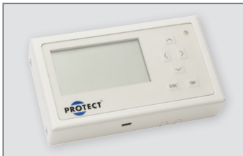
IntelliBox è totalmente compatibile con IntelliSuite. Grazie ad IntelliBox è possibile gestire fino a 16 nebbiogeni via cavo e/o wireless.